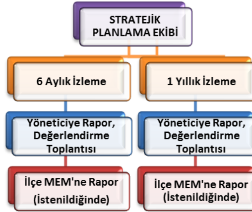
Şekil 2: Stratejik Plan İzleme ve Değerlendirme Modeli

2024-2028 yıllara göre faaliyet raporları (Haziran-Temmuz) hazırlanarak İlçe Milli Eğitim Müdürlüğü Strateji Geliştirme Hizmetleri Şube Müdürlüğüne gönderilmek üzere hazır tutulacaktır.