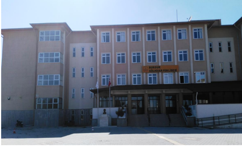
Göhlhisar Fen Lisesi Binası