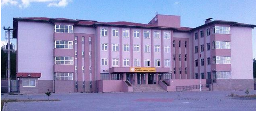
Anadolu Lisesi Binası